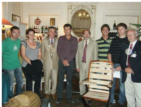
Notre Gouverneur et les lauréats apprentis