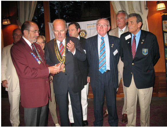
Le Gouverneur et le Comité du Club