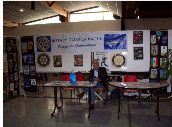
Le Stand du Club au Forum des Associations