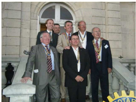
Les Présidents des Clubs du 44 Ouest

Visite du CFA de St Brévin : de nombreux membres du RC La Baule suivent cette visite fort intéressante, sous l'égide du Directeur du centre et des formateurs (ateliers de menuiserie ; plomberie ; chauffage). Ce fut l'occasion de voir de beaux bâtiments, clairs et vastes, dont le plus récent novateur par la disposition de panneaux photovoltaïques disposés au dessus du toit sur une structure en arceau laissant circuler l'air et la lumière.